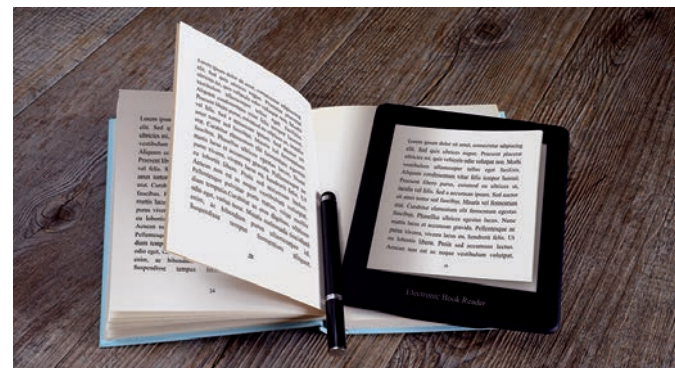
Box 4-5-9, Invierno 2017

Si has asistido a varias reuniones de A.A. durante algunas 24 horas, con certeza sabrás que los A.A. hacen varias cosas bien. Enumerar las habilidades especiales de los alcohólicos tomaría demasiado espacio en un artículo, pero hay una característica que es evidente: Sin importar de dónde provengan, ya sea grandes ciudades, pueblos, montañas remotas o islas tropicales, los A.A. pueden comunicarse bien, con frecuencia y creatividad, y así lo hacen. Incluso los recién llegados a A.A. aceptan con entusiasmo a la Comunidad y celebran su método simple y efectivo de “un alcohólico que habla con otro”. En A.A. llega a su mayoría de edad , Bill W. explicó cuál era esta cualidad especial: “Desde el mismo comienzo, la comunicación en AA no ha sido una mera transmisión de ideas y actitudes útiles. Debido a la afinidad que tenemos por nuestro sufrimiento común, y debido a que los medios comunes de nuestra libe-