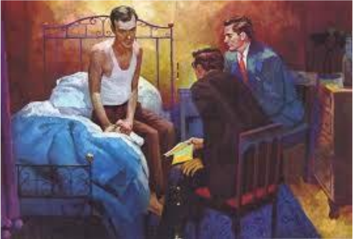
"El hombre en la cama" BOX 4-5-9 Primavera 2012

Solamente hay dos pecados, el primero es interferir en el desarrollo de otro ser humano y el segundo es interferir en el desarrollo de uno mismo- Alcohólicos Anónimos pág. 542 (tercera edición en inglés.)